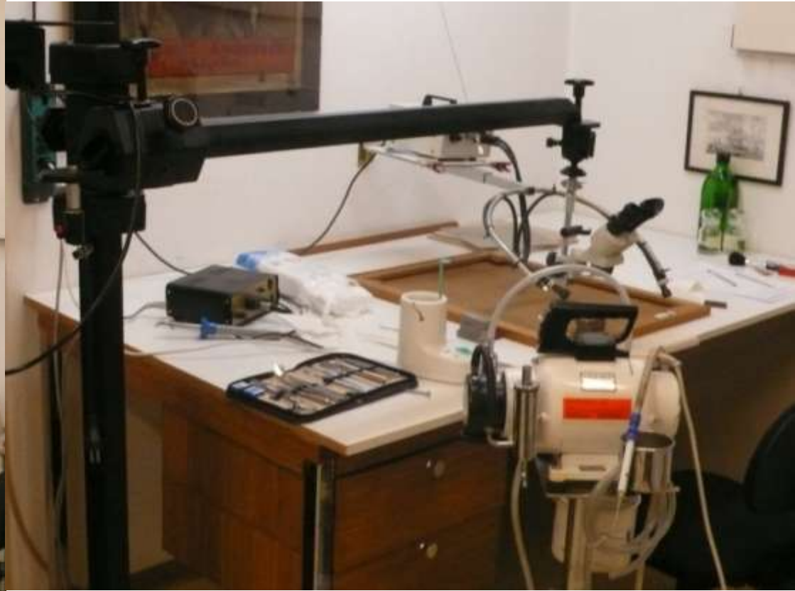
Prototipo Weddigen a Berna in funzione