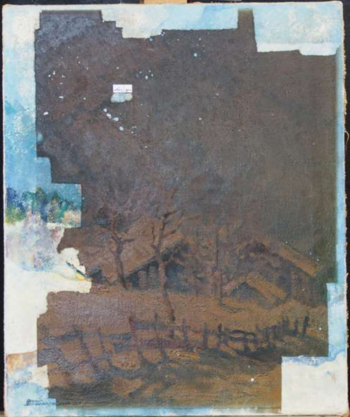
Tela danneggiata da incendio: Prove di pulitura con diversi agenti chimici