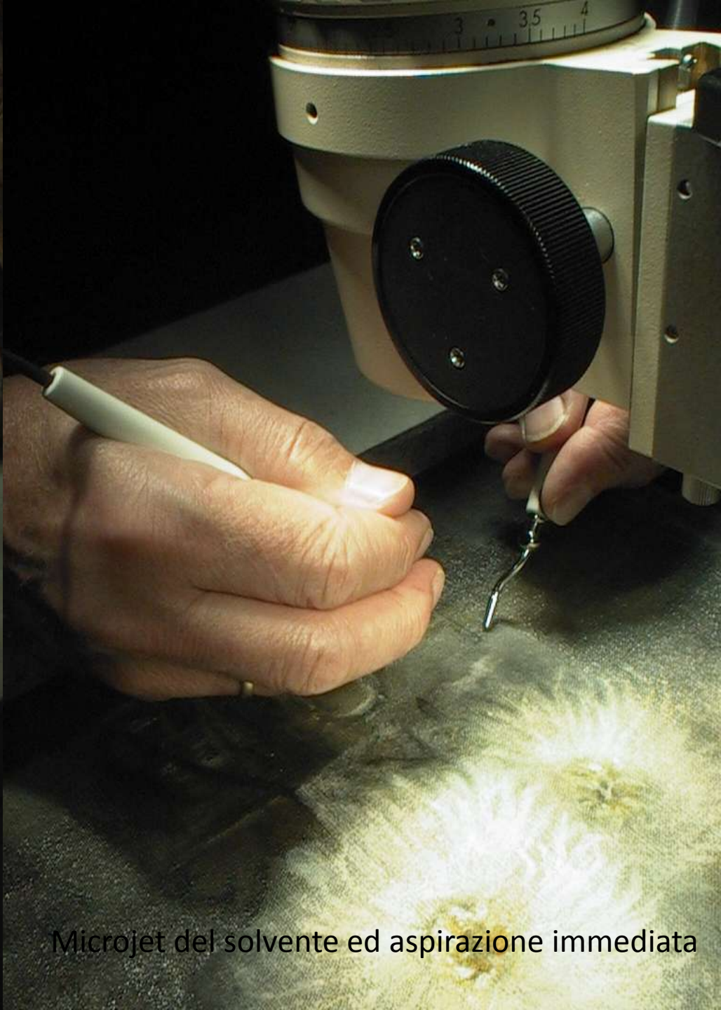
Microjet del solvente ed aspirazione immediata