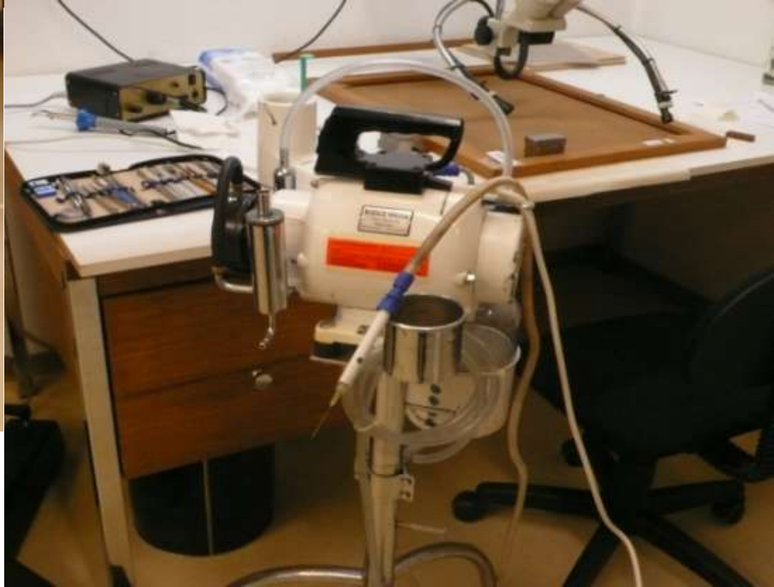
prototipo Weddigen a Berna in funzione